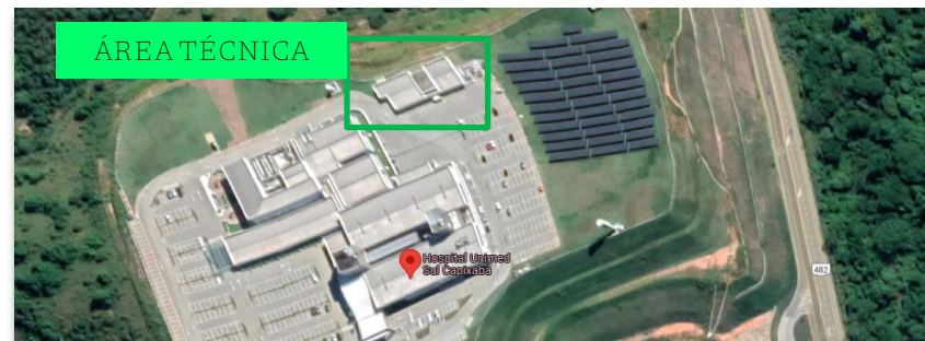
Rod. Eng. Fabiano Vivacqua, 1329 - Tijuca, Cachoeiro de Itapemirim - ES, 29320-899