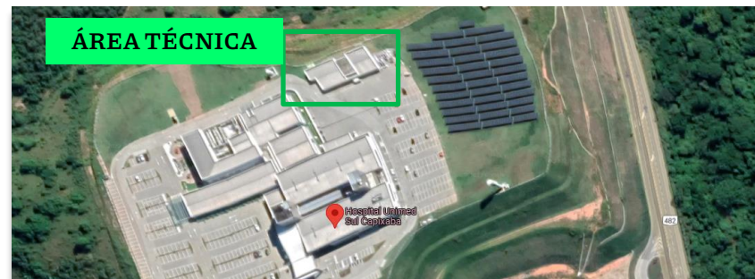
Rod. Eng. Fabiano Vivacqua, 1329 - Tijuca, Cachoeiro de Itapemirim - ES, 29320-899