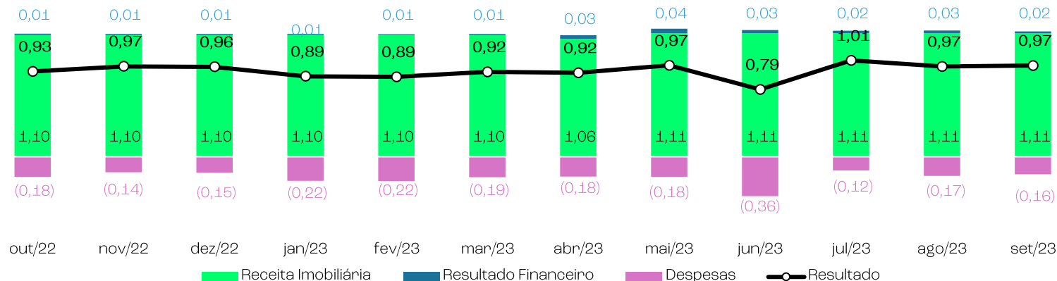
Composição de Resultado nos Últimos 12 meses (R$/cota)

2 Proporção distribuída considera total do montante distribuído dividido pelo resultado do período (valores absolutos).